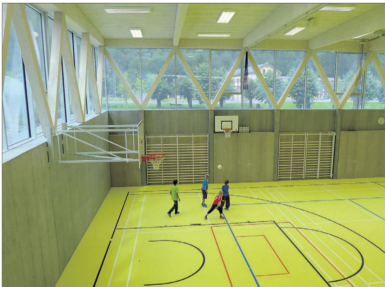
Lichtdurchflutet und kinderfreundlich präsentiert sich die Turnhalle inmitten von Naturschönheiten.