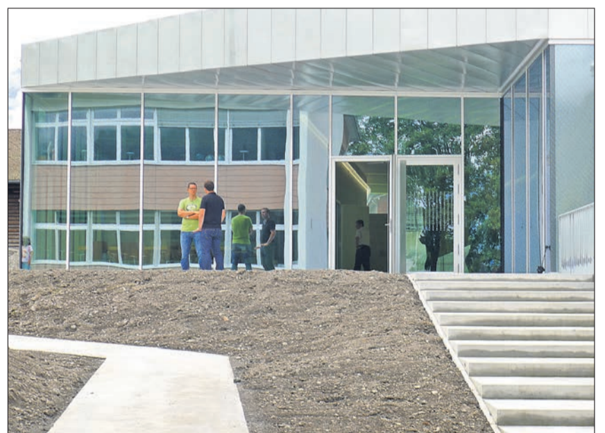
Auch die Umgebungsarbeiten stehen kurz vor der Vollendung.