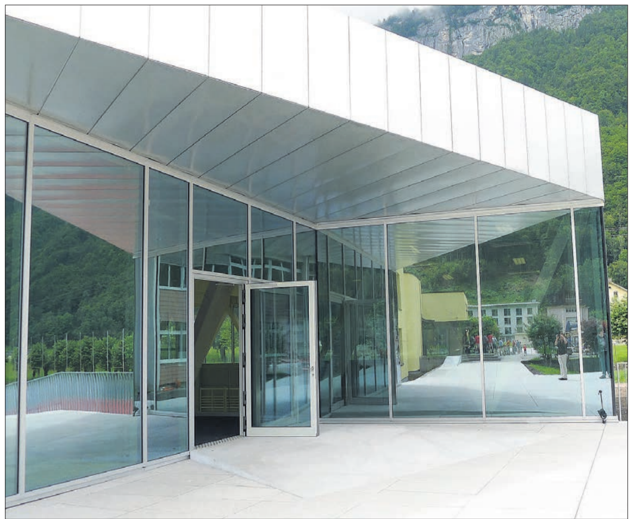
Ein Zeichen modernster Architektur: Der Spiegeleffekt beim Eingang der Turnhalle.

wirkt haben, sind: PS Metall AG, Netstal; Zweifel Holzbau, Glarus; Luchsinger Schreinerei, Schwanden; tbgs Technische Betriebe Schwanden; Steiner Lüftungsanlagen Mollis; Aebli Ofenbau + Plattenbeläge, Linthal; Spenglerei Hösli, Schwanden. Allesamt kompetente und leistungsfähige Unternehmungen, die Wert auf hohe Qualität legen. Und der Vorsteher des Departementes Bau und Umwelt, Fridolin Luchsinger, bestätigte gerne, dass man die geplanten Kosten jederzeit voll im Griff hatte, was den Steuerzahlenden der Gemeinde Glarus Süd gefallen wird. Ende gut – alles gut – Freude herrscht! Die offizielle Eröffnungsfeier der Turnhalle findet am Freitag, 29. August, statt. ● zim.