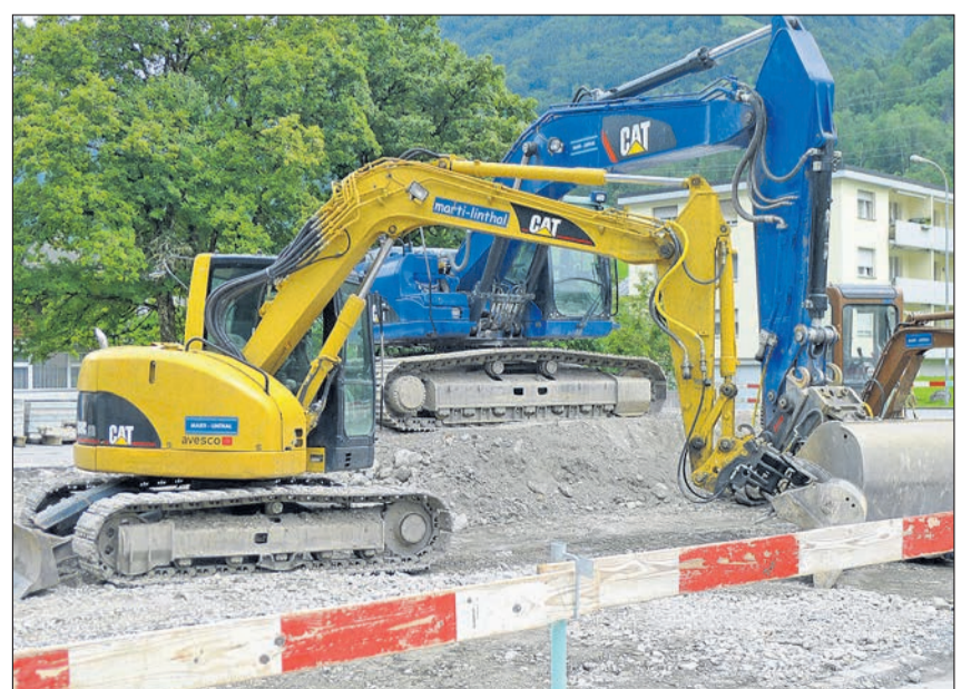
Das einheimische Gewerbe übernimmt auch die Aufräum- und Instandstellungsarbeiten auf dem Schulareal in Linthal.